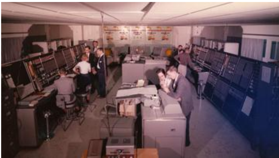
1. ábra: A NORAD 4 egy harcálláspontja 5

A második világháborút megelőző néhány évben egy merőben új technikai eszköz került a légvédelmi csapatok birtokába, mely nem volt más, mint a rádiólokátor (radar), amely a későbbi években, alapjaiban változtatta meg a légvédelem harcászataát. Az Angliai-csata előestéjén valamivel több, mint 20 radarállomás szolgáltatott adatokat légi célokról a szigetországban (Chain Home rendszer) [3]. A radar-adatok alapján irányított védővadászokból és a légvédelmi tüzér csapatok kombinációjából megszületett – igaz kezdetleges formában – az első légvédelmi rendszer. Természetesen a radarállomások pontatlansága és sérülékenysége miatt a harcálláspontokon még túlnyomó részben az optikai figyelő és fülelő pontok által szolgáltatott adatokra támaszkodtak, ennek ellenére világosan látható volt, hogy a légi ellenséget nagy távolságon felderíteni és azokra eredményesen vadászrepülőket vezetni, csak rádiólokátorok birtokában lehet. A háború alatti, a hadban álló felek, sietve kezdtek saját radarfejlesztéseikbe, Oroszországtól kezdve az USA hajóhadáig megkezdődött a lokátorok katonai felhasználása.