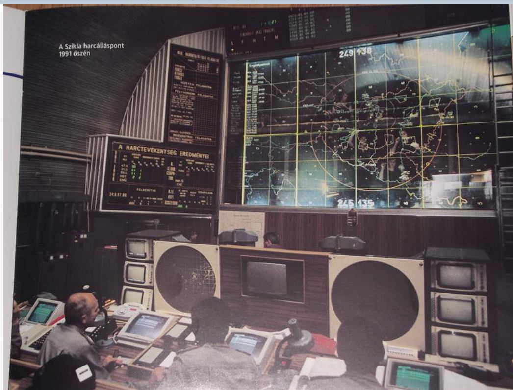
3. ábra: A VSZ-11M rendszerrel felszerelt veszprémi harcálláspont 11

A tanulmány további részében az elfogó–vadászpilóták automatizált „műszeres” rávezetésével kívánok részletesebben foglalkozni, előzetesen viszont érdemes tisztázni azokat a fogalmakat illetve harcászati elveket, amelyek mentén megvalósul a légi célok elfogása.